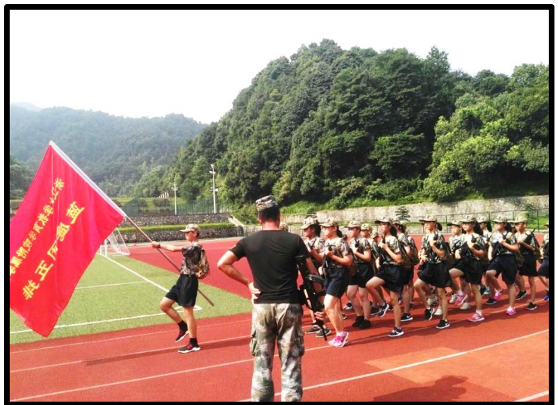
迎风展翅，逆风飞翔

审核：欧自黎 编辑：祝青、何志雄 撰稿：李斌、韩婷、丁嘉程、 陈文聪、周悦、王瑶等 校对：高佳媛、潘涵璐、陈文聪、 高倩云、韩婷、孙卓佳等 美工：高焯 日期：2018年8月14日