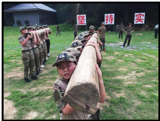
一定不能放下的是——肩上的责任!