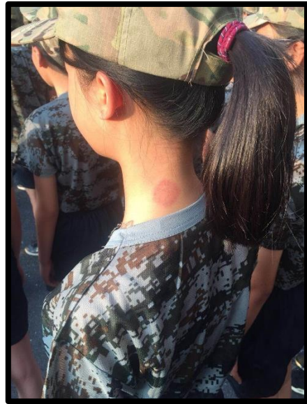
成长道路中最美的印迹!