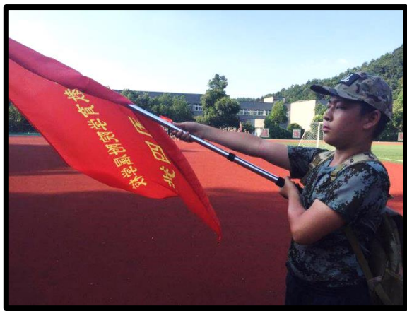
掠影，旗帜飞扬，四班最强