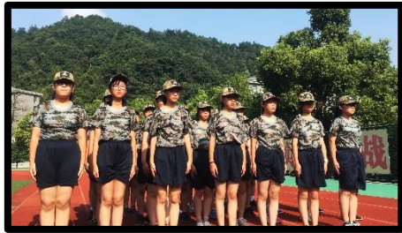
骄阳烈日，五班无畏。 狂风暴雨，五班不惧。